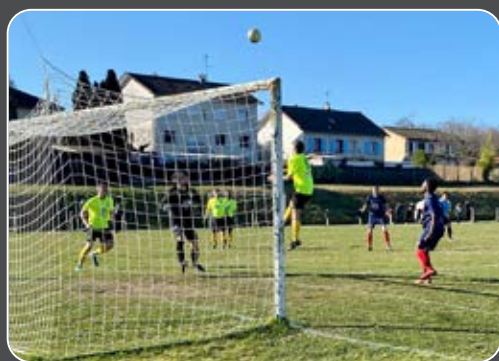
L'USECC face au LF au stade Daniel Devoyon