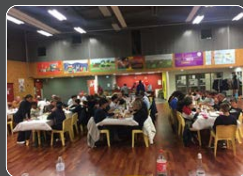
Le repas de l'amicale du Theillois s'est déroulé en toute convivialité