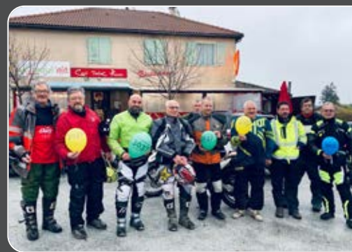
Rando crampons mobilisée pour le téléthon