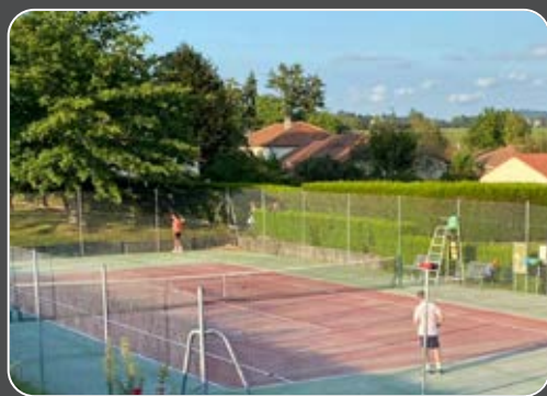
Le tennis club a pu reprendre du service - Accès gratuit pour les Catalacois (renseignement en mairie)