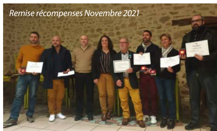
Remise récompenses Novembre 2021