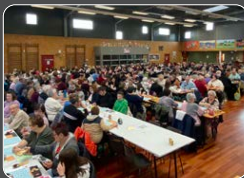
Reprise des Loto avec l'ACCA