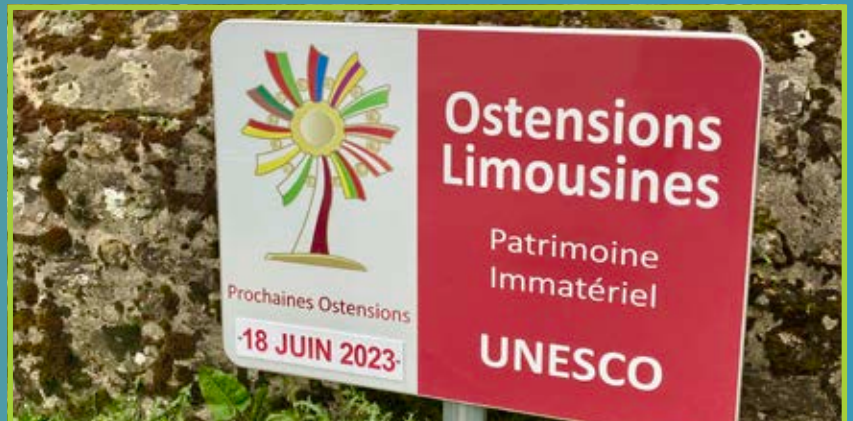
UNESCO : Chaptelat, commune ostentionnaire