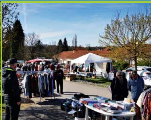
Sortie : vide grenier du Theillol