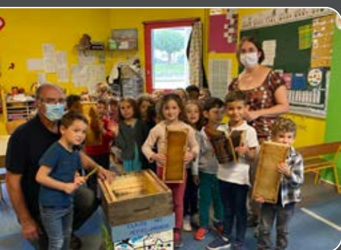
L'abeille noire du Limousin est intervenue auprès des élèves de l'école