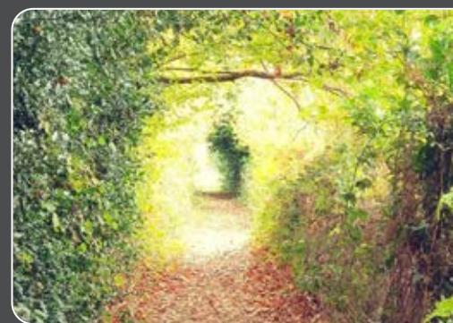
Retrouvez nos circuits de randonnées sur l'application : bit.ly/BaladesetVous21