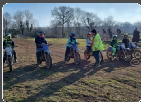
La mini moto connaît un nouveau succès