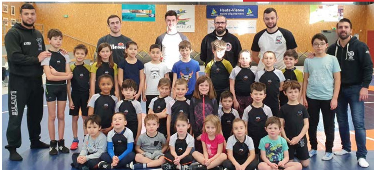
Groupe Jeunes et encadrants Janvier 2020